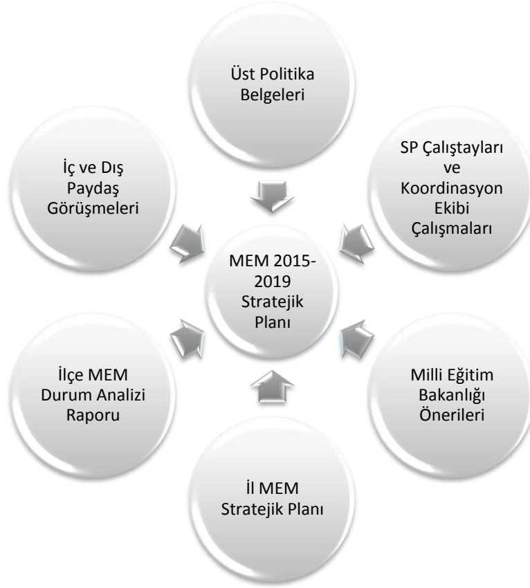
Şekil 1: Plan Oluşum Şeması